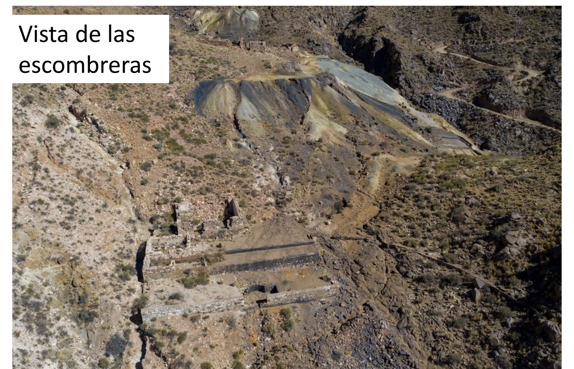
Vista de las escombreras

Con el tiempo se incrementó el sector de escombreras, constituido por una mezcla de minerales originales y alterados, estos últimos particularmente en los estratos superiores, que fueran objeto a procesos de meteorización, requiriéndose no solo su análisis para considerar su eventual valor agregado sino también el material de los niveles inferiores para comprobar reservas y leyes de las especies presentes.