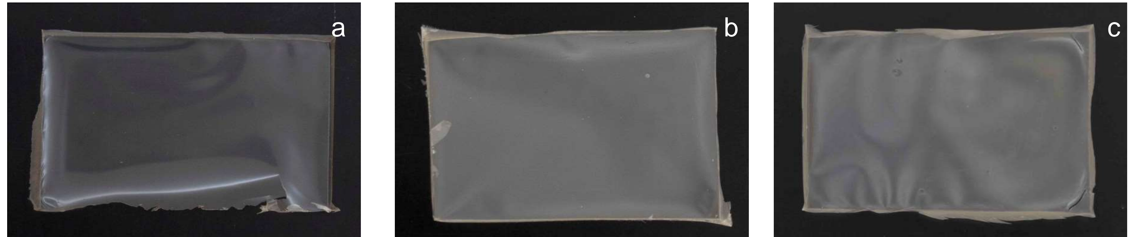
Películas de AS (a); \beta LG-AS (b) y vitD3- \beta LG-AS (c) obtenidas por secado