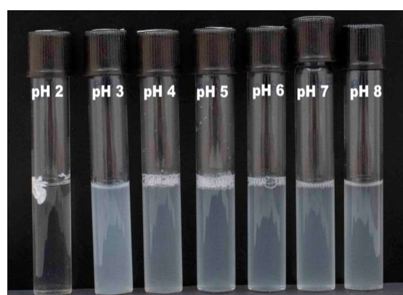
Solubilidad de películas de vitD3- \beta LG-AS a distintos pHs