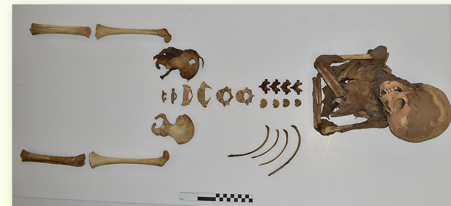
Figura 4. Individuo masculino subadulto extraído de Montaña de Cascajo.