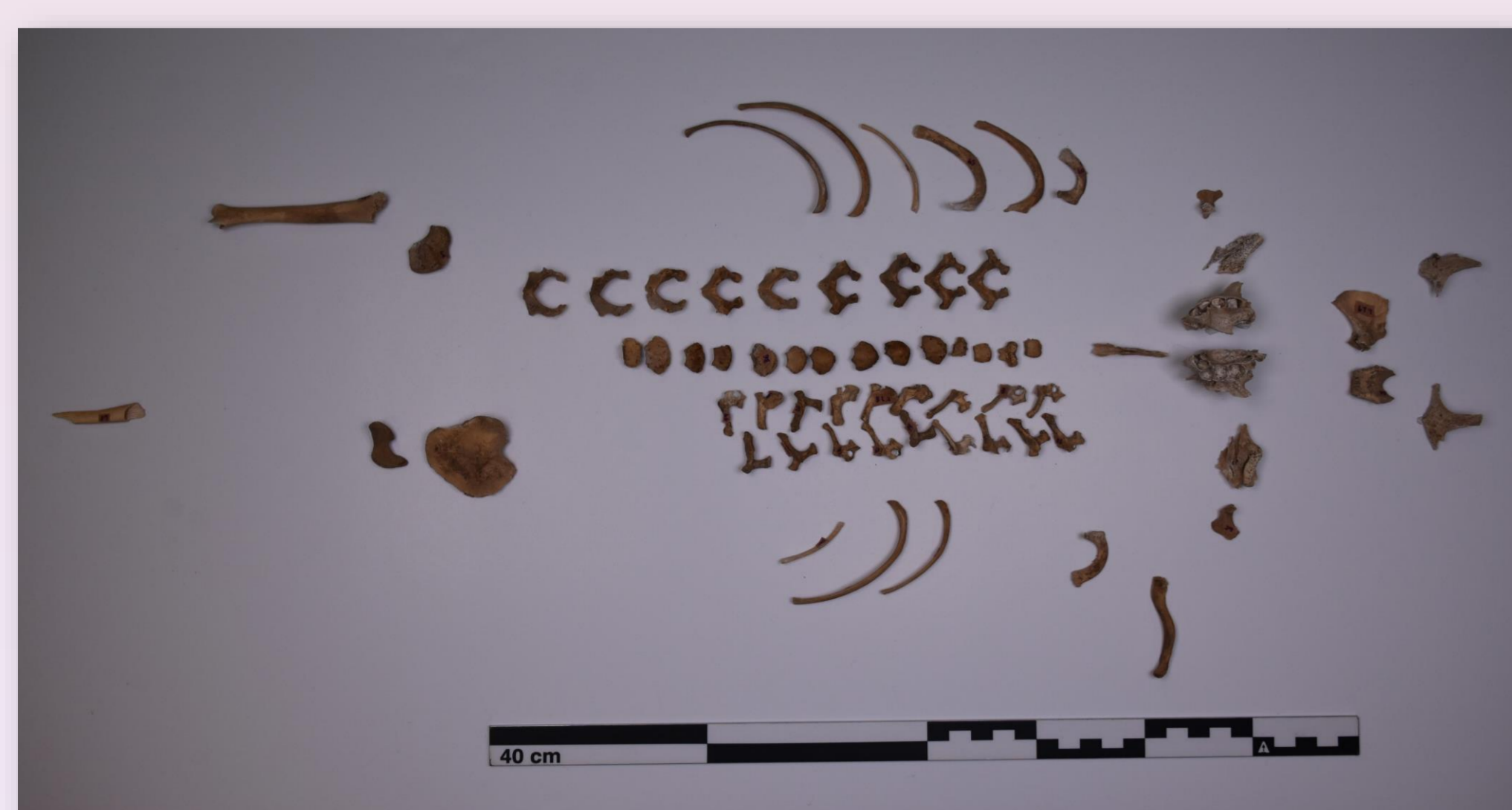
Figura 2. Individuo subadulto femenino extraído de Llano de Maja.