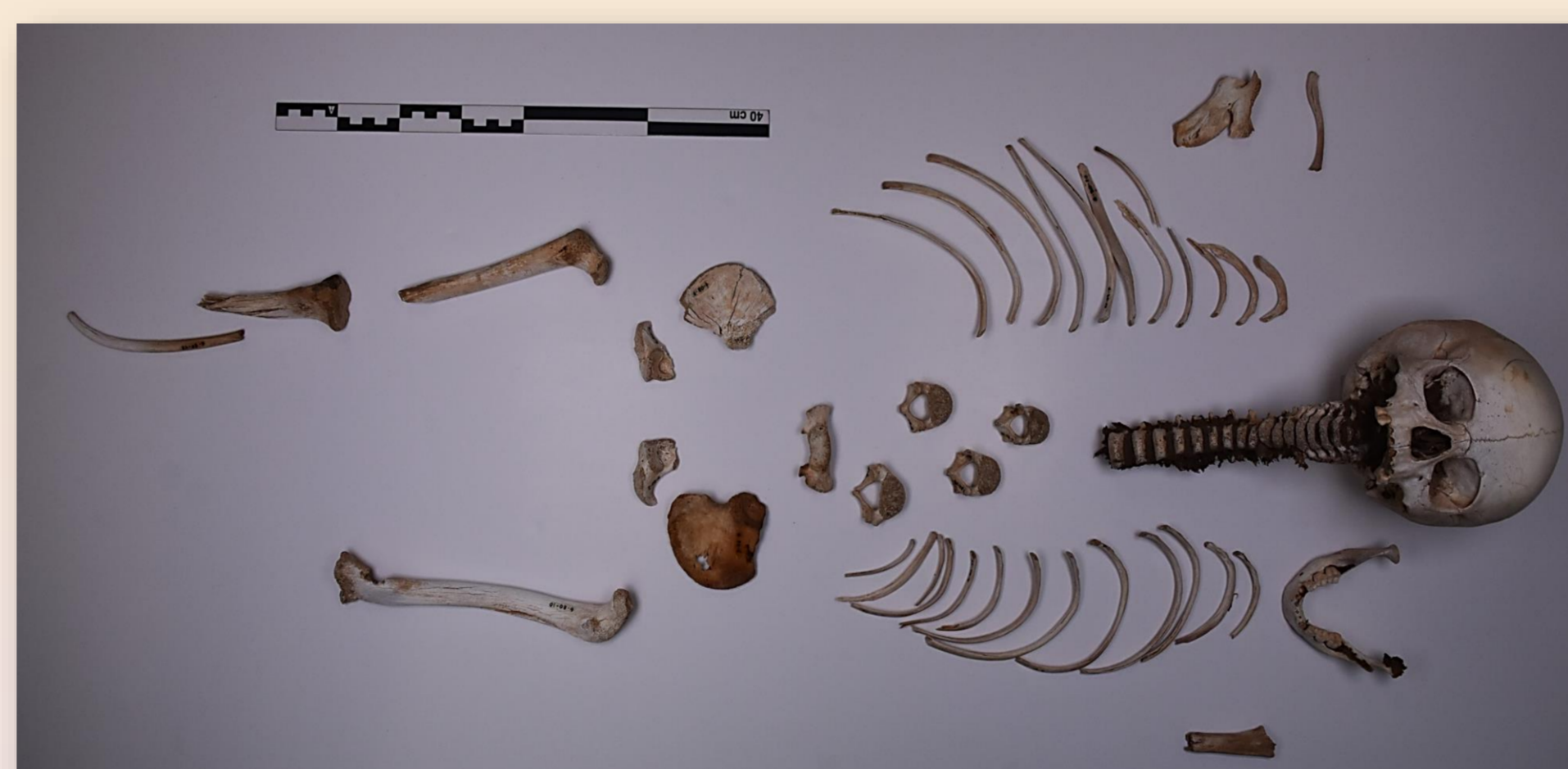
Figura 3. Individuo masculino subadulto extraído de Cañada de La Grieta.