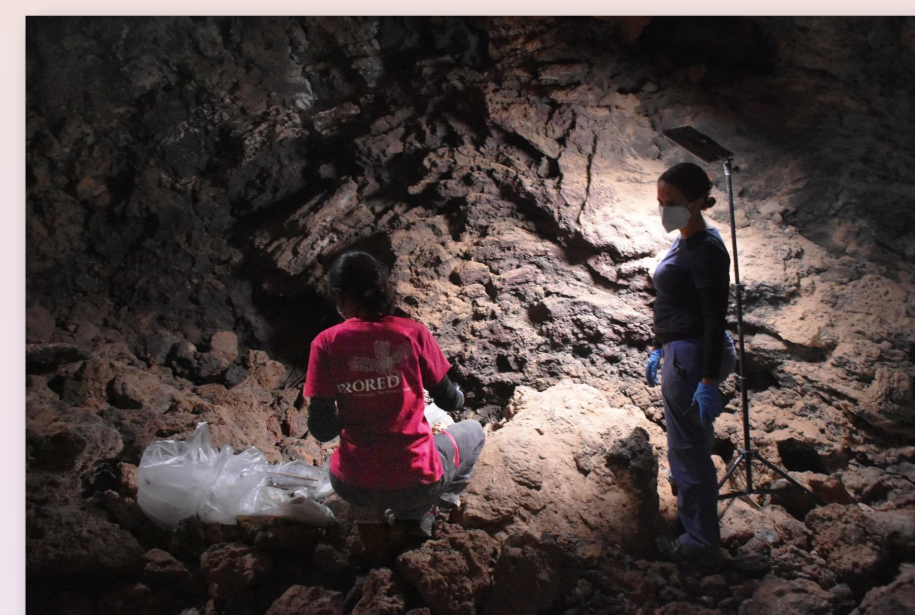
Figura 6. Antropólogas realizando tareas de recogida y selección de material, Llano de Maja en 2020.

Comprender la dimensión de la Infancia a través de evidencias óseas arroja luz no solo sobre los propios sujetos, sino también sobre el ritual funerario que se seguía con los niños y niñas de la comunidad. Ese ritual, tal como muestra el estudio, atiende a factores tan diversos como el contexto geográfico, social, o a los diversos grupos de edad a los que pertenecieron. Es así como se pretende poder seguir ampliando ese conocimiento para el contexto tinerfeño de alta montaña y poder extenderlo a investigaciones de otras islas del archipiélago en próximos trabajos (Fig. 6).