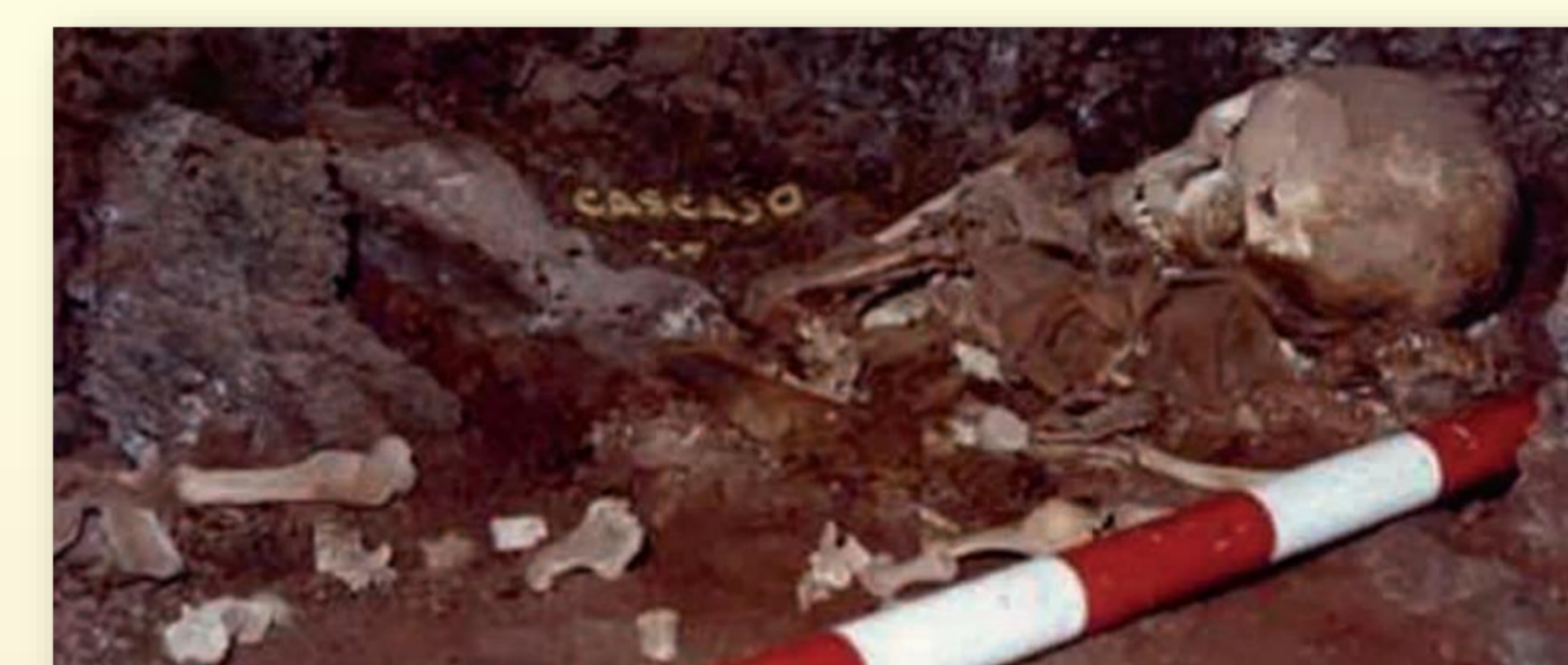
Figura 5. Fotografía del depósito funerario infantil de la Montaña de Cascajo obtenida en la intervención arqueológica de 1977.

Un problema está relacionado con cuestiones metodológicas para la estimación de la edad o la determinación sexual, ya que los individuos subadultos fallecen antes de que la pubertad provoque cambios morfológicos. Otro inconveniente es la ausencia de noticias en las fuentes documentales sobre la población infantil de la isla.