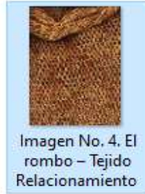
Imagen No. 4. El rombo - Tejido Relacionamiento