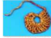
Imagen No. 2. Circulo-origen del tejido social Inkal Awá.