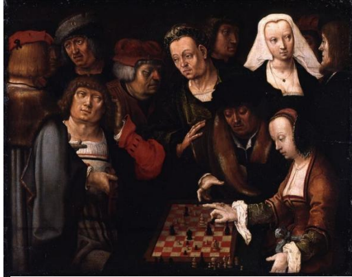
Imagen 2. La partida de ajedrez de Lucas van Leyden (1508)

La luz en las obras de Vermeer se incorpora desde un lado de la sala, por lo general desde el lado izquierdo, como ocurre también en Caravaggio (1571-1610). En ellas, las luces y las sombras, se alternan de manera sutil creando una ilusión de espacio que define su estilo. Vermeer, además, investigó en profundidad el uso de la perspectiva para organizar sus composiciones y en La carta de amor es ella quien guía la mirada del espectador a través de los distintos planos.