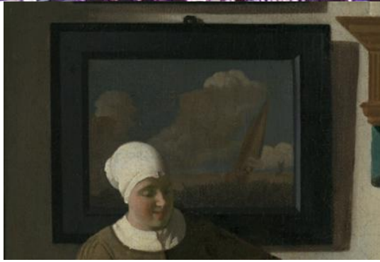
Imagen 3. Detalle de La carta de amor de Johannes Vermeer