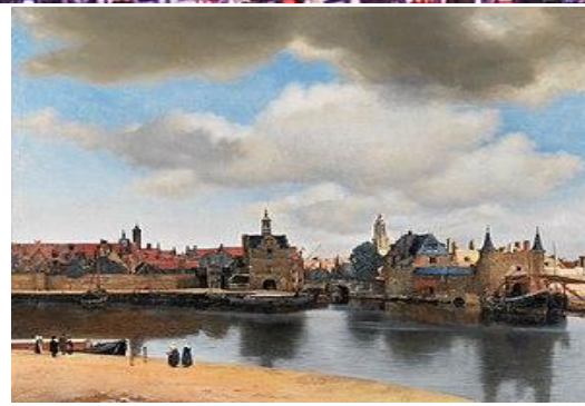
Imagen 4. La visita de Delft de Johannes Vermeer (1660-1661)