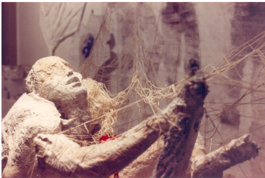
Figura 1. Fotografía de la escultura de la Tierra Malamada, Maratón de los Antihéroes, Centro de Artes Visuales, La Plata, del 7 al 27/5 de 1988, Compañía de la Tierra Malamada.