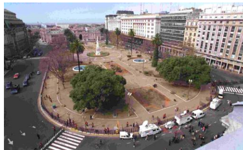
Plaza de Mayo