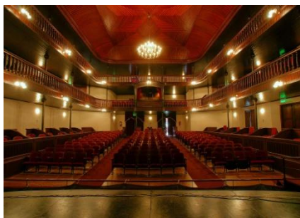
Teatro Español - Magdalena