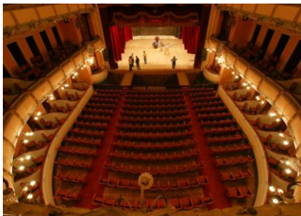
Teatro Municipal Tres de Febrero Paraná