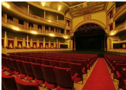
Teatro Municipal Coliseo Podestá La Plata

Lugares que son utilizados por los músicos –o propuestos por los compositores– pero que fueron concebidos inicialmente para otro uso: espacios públicos abiertos o cerrados, plazas, iglesias, galpones, estadios.