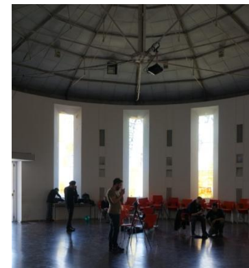
Auditorio Tanque UNSAM