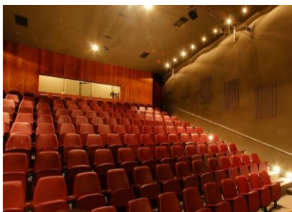
Teatro de Cámara - City Bell