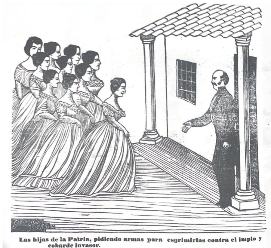
Fig. 1: Las hijas de la Patria, pidiendo armas para esgrimirlas contra el impío y cobarde invasor. Autoría desconocida. 1862. Cabichuí.