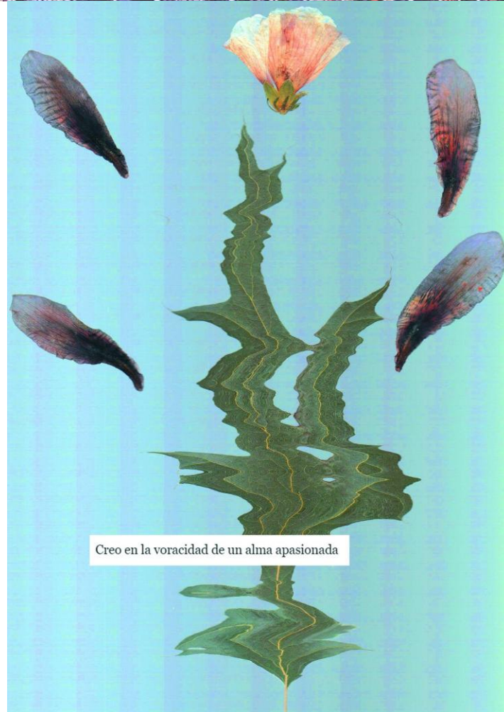
Figura 3. Estefanía Ferrari (2022). ¿Qué se sentirá tener tanta certeza en la vida? Escanografía botánica. Página 12 del fanzine digital. Recuperado de: https://issuu.com/estefaniaferrari/docs/tapa_img7_1_merged

Por otro lado, en las fotografías donde predomina la construcción espacial de la composición [Figura 4] se trabajó a tapa abierta manteniendo oscuro el cuarto de trabajo. La iluminación sectorizada y los múltiples planos de enfoque capturan los volúmenes con un efecto estético característico del escáner que es logrado por el tiempo de exposición propio de los fotosensores lineales.