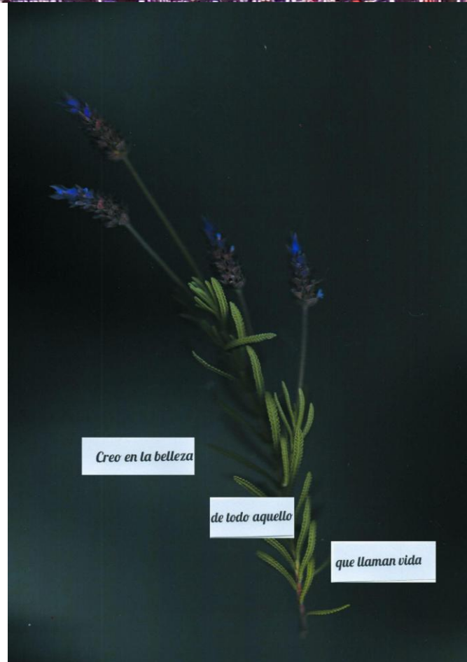
Figura 4. Estefanía Ferrari (2022). ¿Qué se sentirá tener tanta certeza en la vida? Escanografía botánica. Página 7 del fanzine digital.