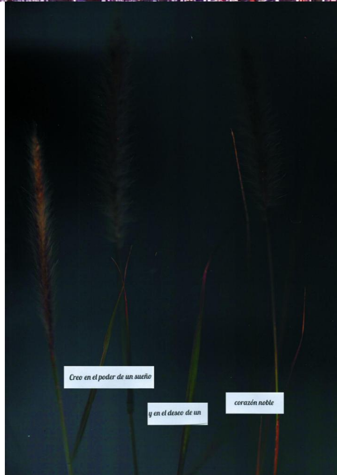
Figura 2. Estefanía Ferrari (2022). ¿Qué se sentirá tener tanta certeza en la vida? Escanografía botánica. Página 9 del fanzine digital.

En las imágenes que exploran el recurso temporal [Figura 3], se trabajó a partir de la deformación de las plantas. Utilizando flores desecadas y prensadas que se movieron manualmente sobre el plano del escáner. Esta acción se realizó cuidadosamente sin contaminar visualmente con los dedos o herramientas utilizadas.