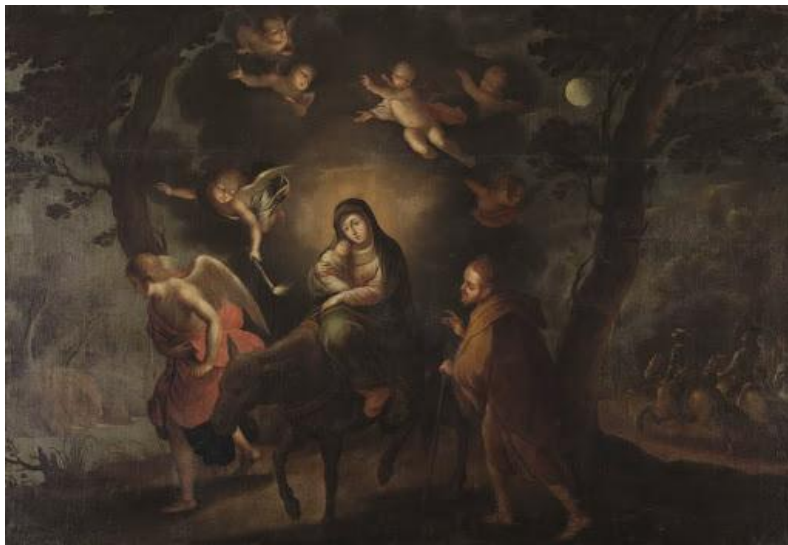
Figura 1. La Huida a Egipto (Siglo XVII). Gregorio Vásquez Óleo sobre tela. 113 x 142 cm Museo Colonial

Si bien el pintor mostró preferencia por los temas marianos, dos de sus obras más importantes de las que hoy tenemos registro, son La Huida a Egipto (Fig.1) y El Símbolo de la Trinidad (Fig.3). La admiración por la primera, que fue inspirada en un grabado de Marinus Robyn (1599-1639) sobre la Huida a Egipto de Rubens, se debe principalmente a que tras haber visto el óleo homónimo de Vásquez en la iglesia Dominica de Santa Fe, Alexander Von Humboldt editó algunas notas al respecto en donde describía la obra como la mejor pintura lograda por el santafereño. Sus particularidades giran en torno al antes y el después en el género del paisaje que, durante el siglo XVI, se desarrolló a partir de la iconografía de La Huida a