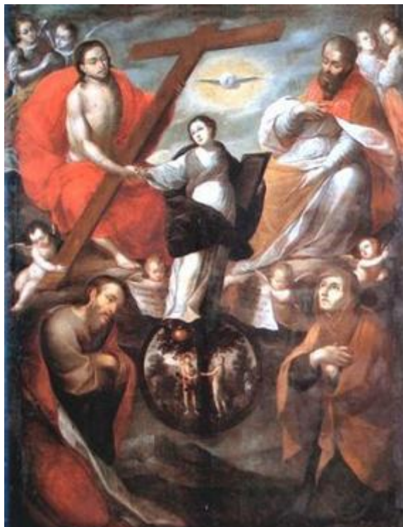
Figura. 4 Inmaculada Concepción (siglo XVII) Gregorio Vásquez de Arce y Ceballos. Óleo sobre tela.

La estructura de la obra (Figura 4) está compuesta por una tríada en la zona central de la