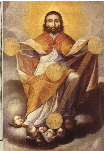
Figura. 3. Símbolo de la Trinidad (1680) Gregorio Vásquez de Arce y Ceballos