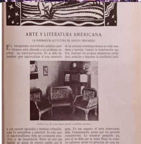
Figura 3. Portada de la Revista del Ferrocarril Provincial de Buenos Aires N.º 6 (noviembre y diciembre de 1927)