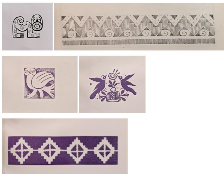
Figura 2. Grabado de ajuste de página extraído de la Revista del Ferrocarril Provincial de Buenos Aires N.º 3 (agosto de 1927)

Figura 1. Mosaico creado a partir de motivos americanos extraídos de diversos números de la Revista del Ferrocarril Provincial de Buenos Aires (1926-1932)