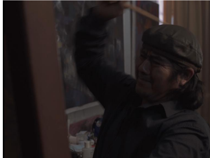
“A trazo muerto” (00:05:54)