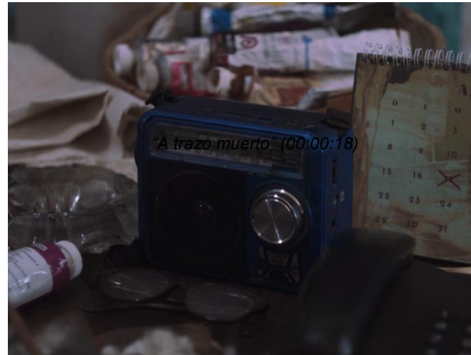
"A trazo muerto" (00:00:18)

encuadre, los claros oscuros en la iluminación que contrastan ese desplazamiento, la opresión y aquella discriminación que habitualmente sufre el artista de la periferia. La misma sensación de encierro y asfixia se ve en la profundidad de campo, donde se genera un espacio acotado, generando un fondo desenfocado, creando una imagen chata 1 entre personaje y el fondo, o entre los objetos y el fondo.